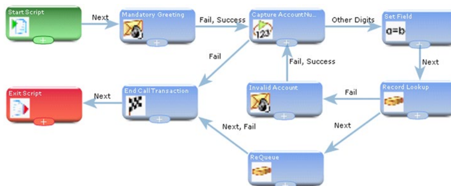
Slika 1 – primer IVR skripte dizajnirane u Softdial Scriptor™-u

Slika 1 prikazuje tipičnu IVR skriptu koja je dizajnirana u Softdial Scriptor™-u. Pravougaone ikonice predstavljaju par standardnih koraka skripte, od preko 50 obezbeđenih u programu. Da bi kreirao skriptu korisnik samo treba da prevuče odgovarajući korak na prostor za dizajn. Koraci se povezuju prevlačenjem veze sa strelicom među njima. Izlaz iz koraka se podešava tokom procesa povezivanja u jednom koraku.